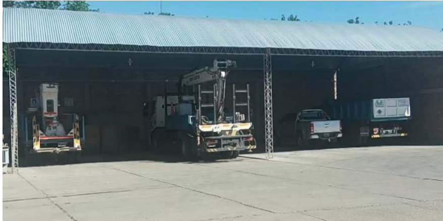
Fotografía de la movilización de camiones para el servicio eléctrico 2018.archivo fotográfico de la cooperativa electrica.Rivadavia.Mendoza

Los usuario reciben el servicio eléctrico y se les ofrece artefactos y componentes eléctricos-electrónicos el área de guardia trabaja las 24 horas del día .En cuanto a los Frigorífico – Laboratorio se realiza una solución de salmuera para utilizarla como enfriador, y también el tratamiento del agua para consumo humano librándola de amoníaco.