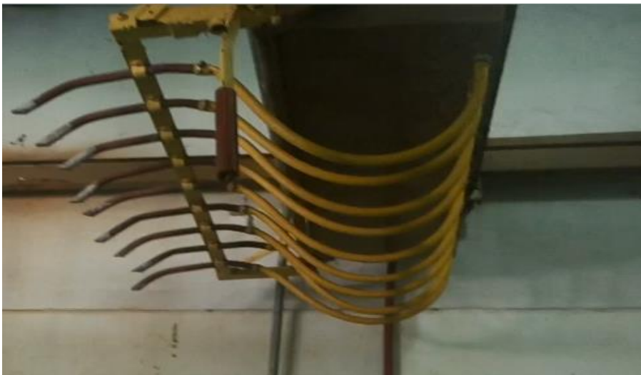
Fotografía de Picos que traen el agua tratada y la depositan en piletas.2018.Archivo fotográfico de la cooperativa electrica.Rivadavia.Mendoza

Los usuario reciben el servicio eléctrico y se les ofrece artefactos y componentes eléctricos-electrónicos el área de guardia trabaja las 24 horas del día .En cuanto a los Frigorífico – Laboratorio se realiza una solución de salmuera para utilizarla como enfriador, y también el tratamiento del agua para consumo humano librándola de amoníaco.