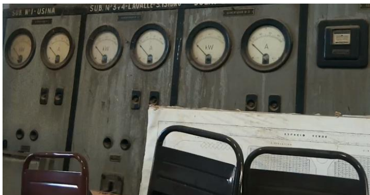
Fotografía de la Usina 1947. Archivo fotográfico de la cooperativa de Rivadavia. Mendoza

Con respecto al mantenimiento se realizan reparaciones de transformadores y otros aparatos eléctricos-electrónicos.