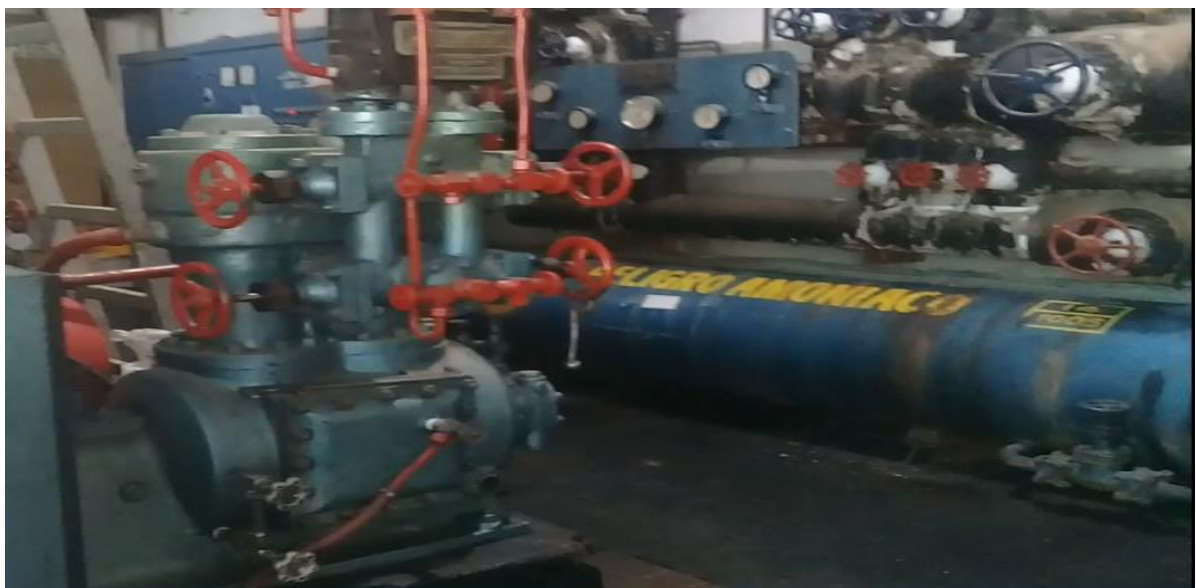
Fotografía de Motores y contenedores de amoníaco.2018.Rivadavia.Mendoza

La cooperativa como una entidad sin fin de lucro no tiene ganancias más allá que sea para generar los sueldo o el mantenimiento de la misma por medio de los servicios que brinda, siendo estos la electricidad e internet, también posee un frigorífico el cual trabaja con salmuera y trata el agua para consumo humano.