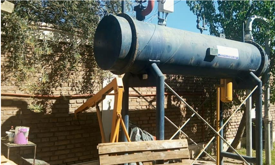
Fotografía de ablandador de agua.2018.Archivo Fotográfico de la cooperativa electrica.Rivadavia.Mendoza