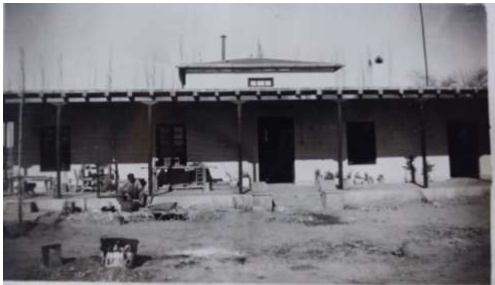
Figura 3= Administración año 1.919

Había sido designado por el Banco Español Administrador de estas tierras que en aquella época eran áridas y desérticas.