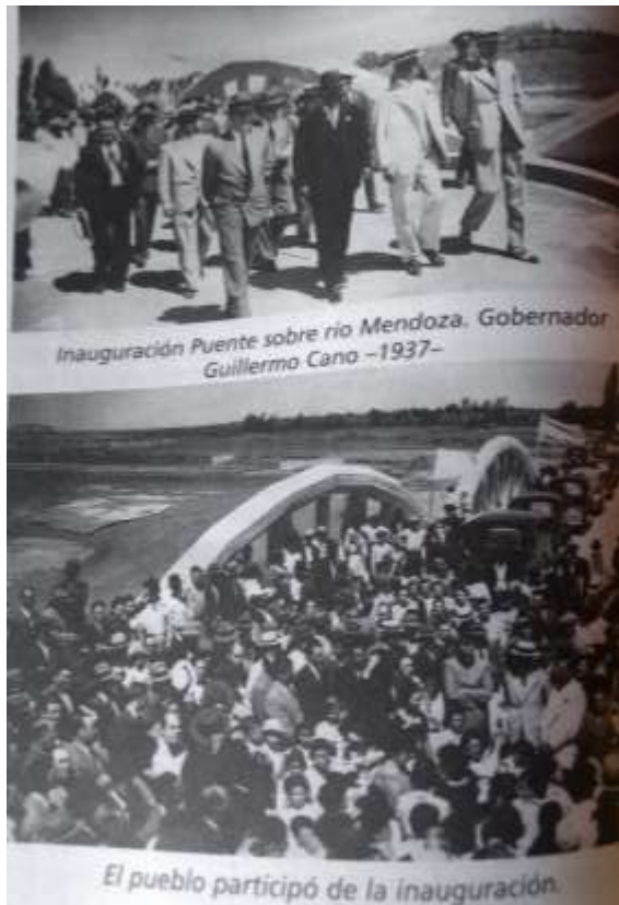
Inauguración Puente sobre río Mendoza. Gobernador Guillermo Cano - 1937-