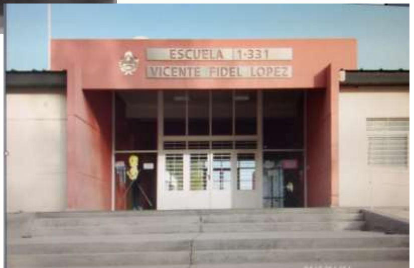
Figura 6= Escuela N° 1-331 Vicente F. López