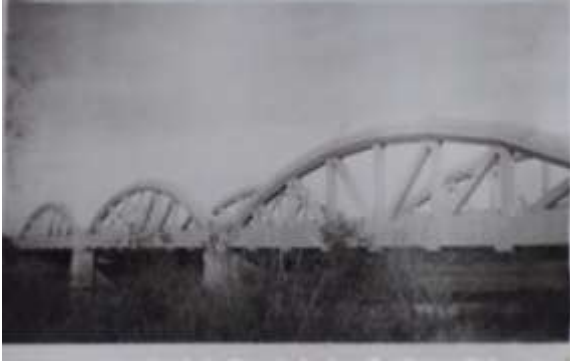
Figura 8= Puente ferrocarril del Estado.

Con la terminación del mismo la colonia adquirió libre comunicación con el Departamento Lavalle y Ciudad de Mendoza Factor decisivos en su desenvolvimiento económico.