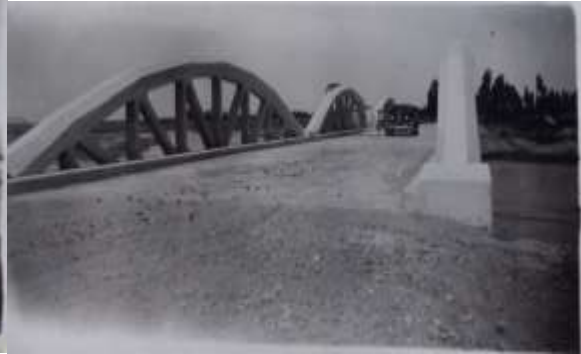
Figura 9= Puente carretero Departamento de Vialidad.