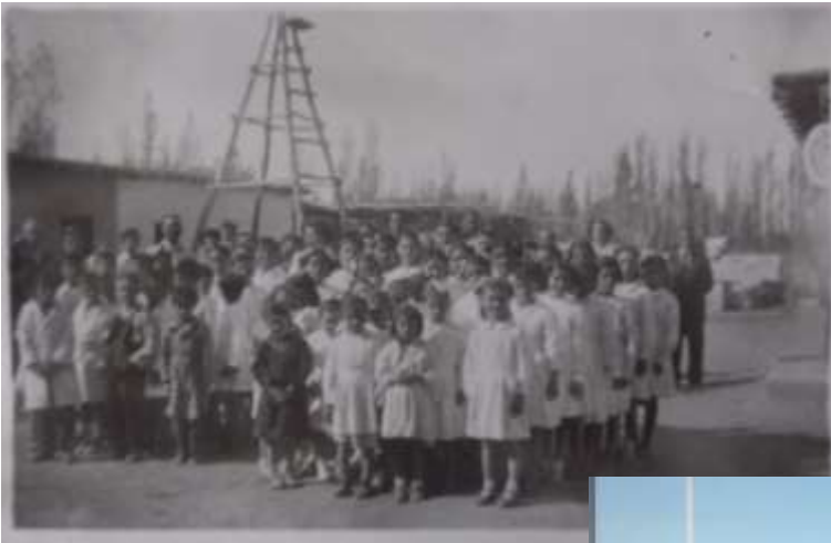
Figura 5= Escuela Nacional 162

Ambas escuelas contaban con una comisión cooperadora de madres que trabajaban con el fin de recaudar fondos y ayudar a los alumnos con útiles escolares.