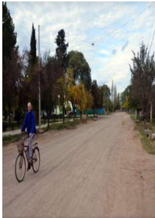
Figura 21= Calles de tierra del pueblo