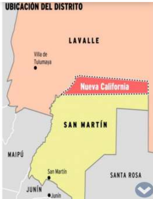
Figura 1= Mapa de Mendoza que resalta Nueva California.

– Se encuentra al noreste y sus límites son al Norte con el departamento Lavalle, al Oeste con Maipú y Lavalle, al Este con Lavalle y Santa Rosa y al Sur con Junín.