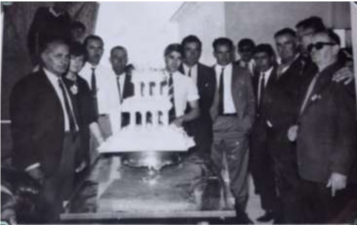
Figura 17= Familiares de los Primeros Colonos.