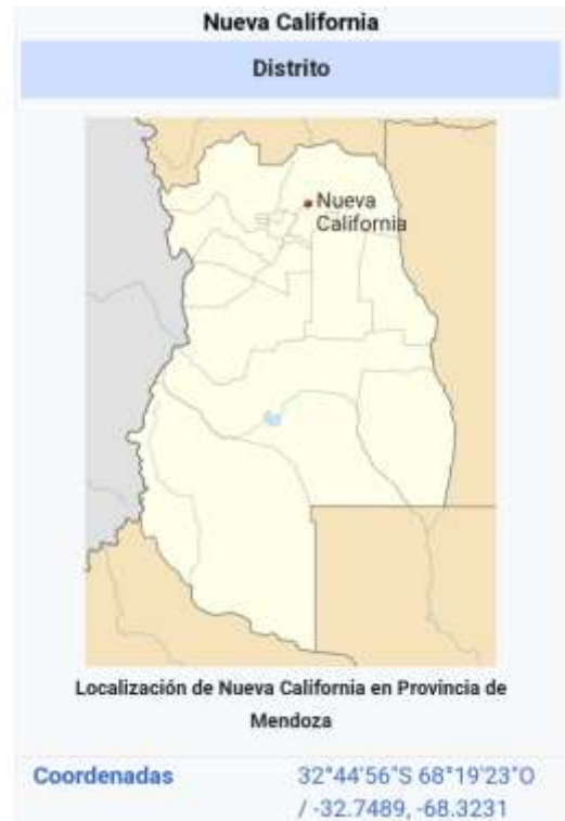
Figura 2= Ubicación de Nueva California dentro de San Martín.