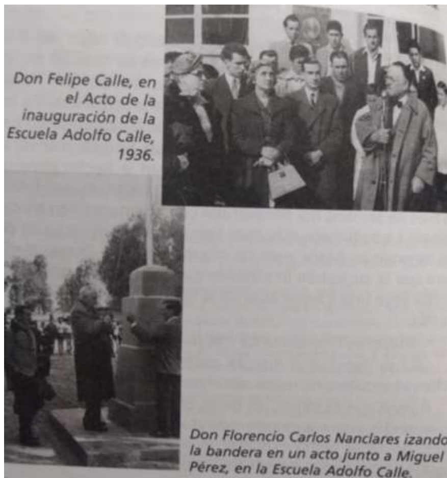
Figura 7= Foto familiar