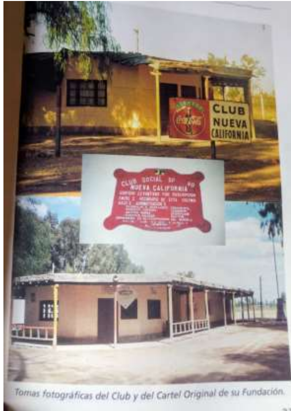
Figura 12= Foto de Club Social 1.944

Este edificio contaba con luz eléctrica generada por dos motores a explosión. A su inauguración asistió el vicegobernador Sr. Smith.