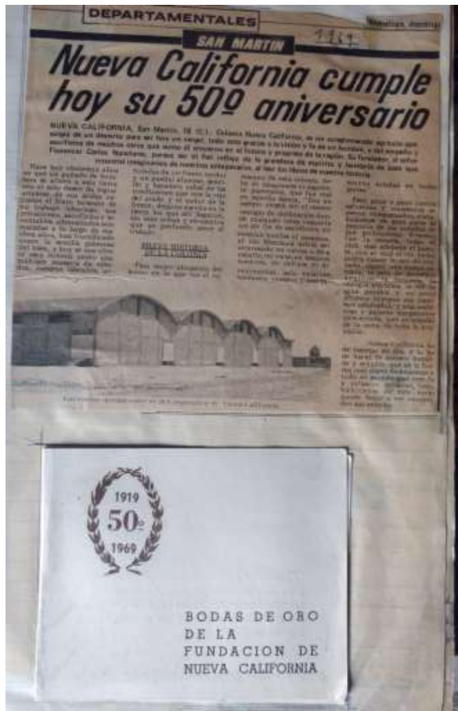
Figura 15= 50 aniversario