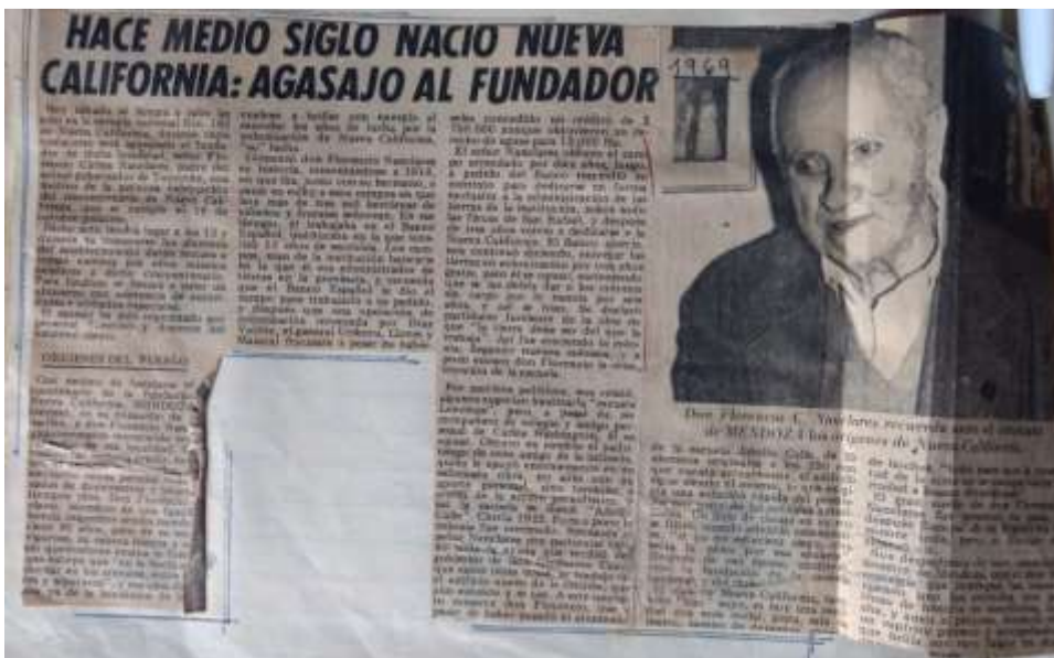
Figura 14= 50 años de Nueva California

En 1969 Nueva California cumple 50 años de su fundación. Se realizaron actos emotivos donde se distinguió a los hijos de los primeros colonos en llegar.