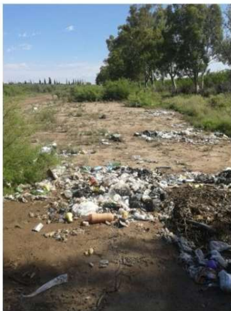
Figura 22= Calles con falta de mantenimiento y asfalto.