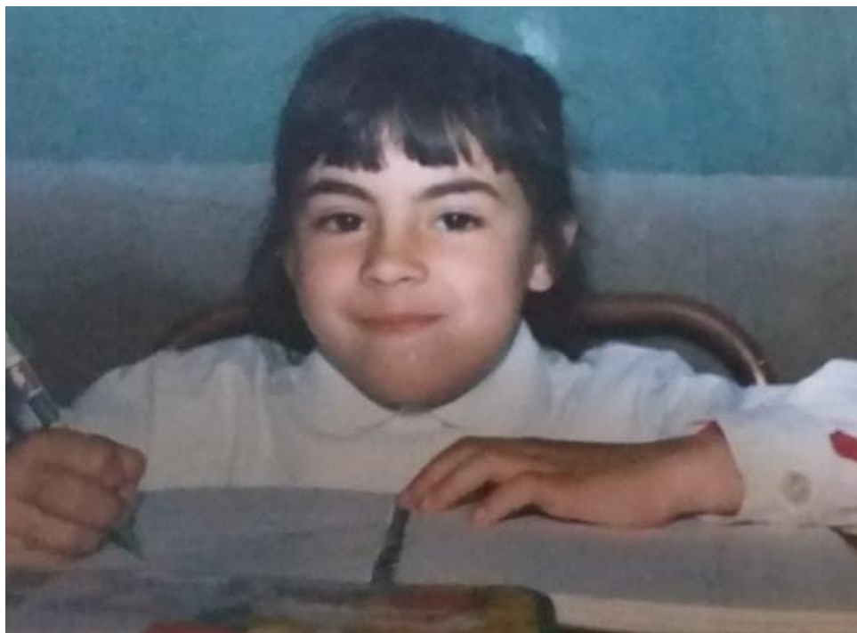
Figura 11: Tradicional foto de Comienzo de clases.

El grupo humano que formamos fue hermoso. Aún mantengo la amistad con muchos de ellos, la mayoría ya profesionales, con sus familias formadas.