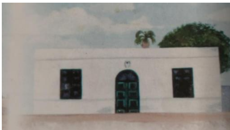
Figura 3: Segundo Edificio Escolar.

los alumnos en las horas de labores” quien fue maestra al igual que su madre, del mismo establecimiento. (Herrera, 2000, p.4)