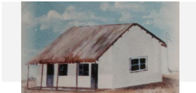
Figura 2: Primer Edificio Escolar.

Su primer edificio fue un rancho, que ocupaba el lugar en que hoy funciona la Oficina del Correo, en esos lejanos comienzos llevó por nombre el de Escuela Elemental Media El Retamo, adquirió su actual denominación por Resolución Nº 609 del 10/11/1914, firmada por el Director General, Profesor Manuel Pacífico Antequera. Fue mixta desde su fundación y durante décadas fue el único establecimiento escolar en muchos kilómetros a la redonda. "En aquellos primeros años venían alumnos de toda la región, algunos de ellos después de haber recorrido varios kilómetros y desde entonces esta escuela empezó a edificar el reconocimiento que hoy tiene" (Di Césare.2010, p.1).