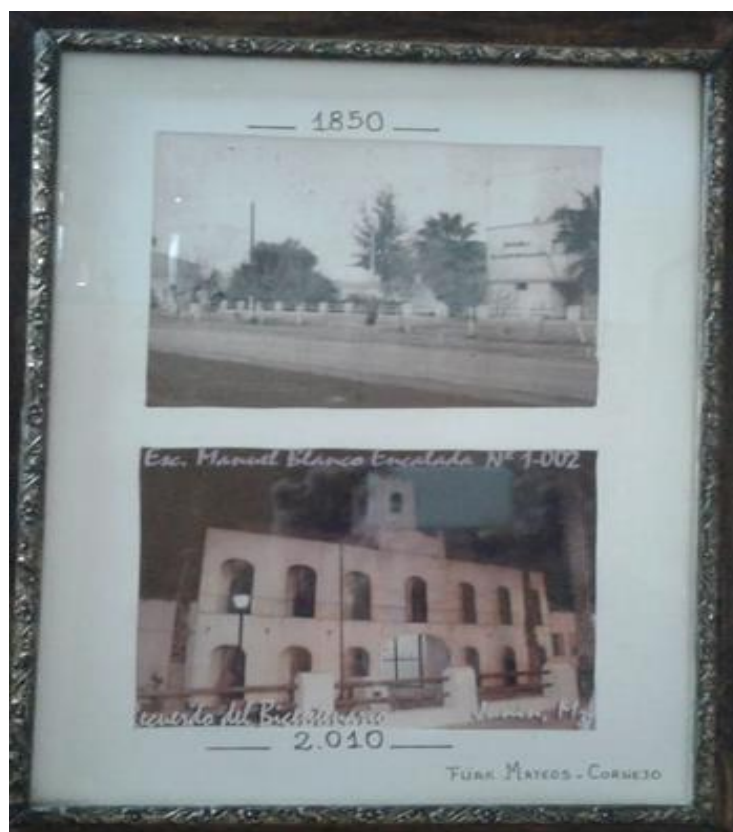
Figura 5: Comparación entre Edificios Escolares.

"Es una de las escuelas más prestigiosas del Este, ejemplar y con un muy buen nivel de enseñanza" (Martín, 2010, p. 2). Y Luna (2010) cierra "Es de esas escuelas donde la maestra sabe la responsabilidad que tiene porque, la historia pesa más de lo que uno cree" (p. 2).