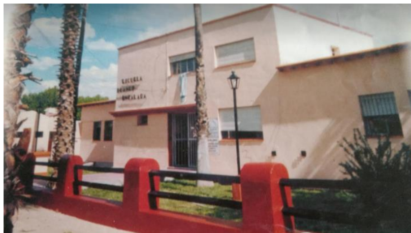
Figura 4: Tercer y último Edificio Escolar.