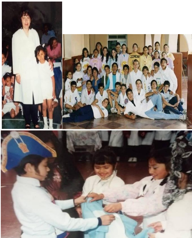
Figura 8,9 y 10: Actos Escolares y Fin de curso.

Como recuerdos destaco los actos escolares donde actuábamos y bailábamos, todos empilchados y maquillados según la fecha. Algo bonito que recuerdo es la despedida de 7mo grado y firmarnos los guardapolvos el último año de la primaria, era una actividad llena de alegría y unidad en la que conociéndonos más o menos, todos nos llevábamos las firmas de todos a casa.