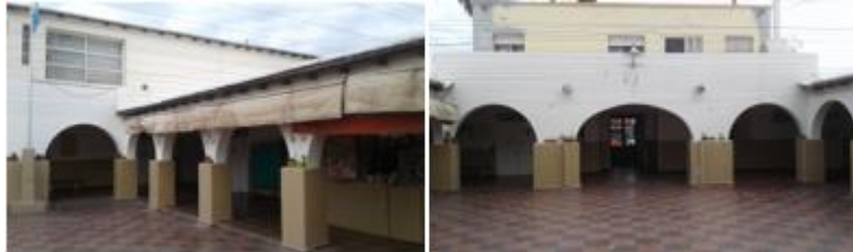
Figura 7 y 8: Galerías Escolares.