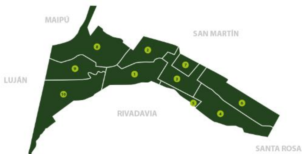
Figura 1: Departamento de Junín, provincia de Mendoza, Argentina.

Fuente: Sitio Web Municipalidad de Junín.